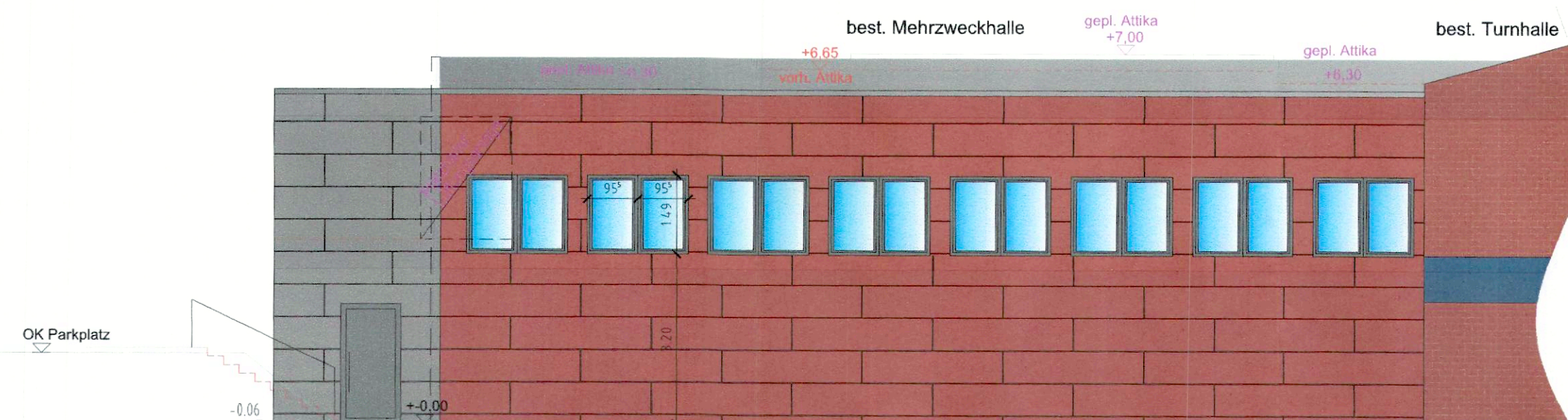
Ostansicht M. 1:100